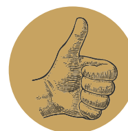
ALTERNANCE : ENTREPRISE / MFR