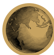
SORTIES ET VOYAGES PÉDAGOGIQUES