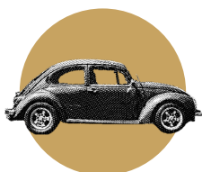
ASSR NIVEAU 2