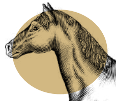
Demi-journées hebdomadaires en centre équestre