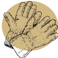
Visites de structures et interventions de professionnels